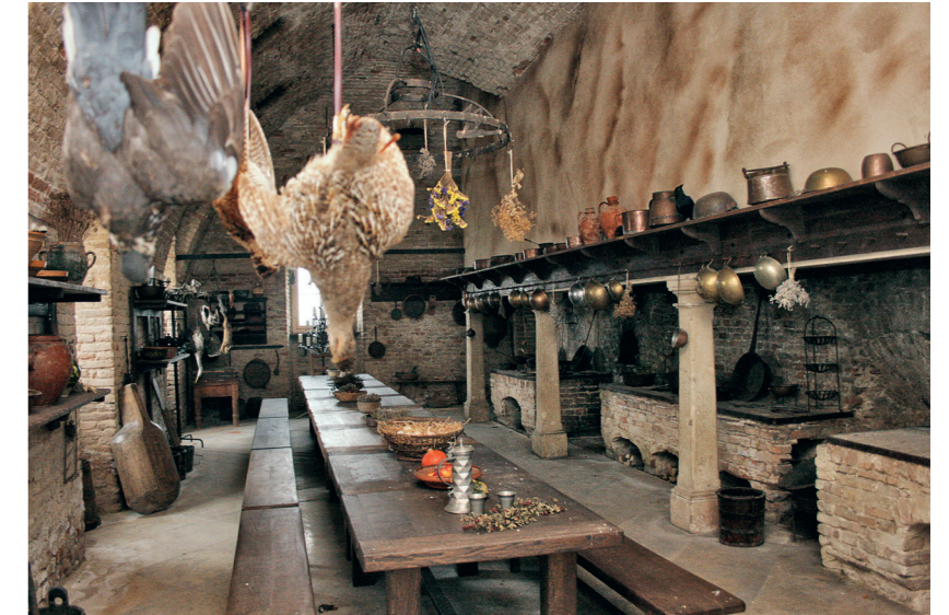
Cuisine à gibier du Schloss Niederweiden.