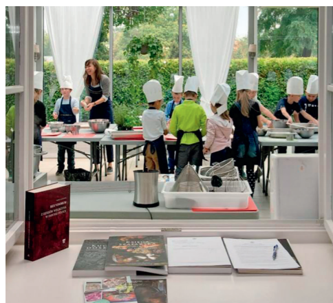
Musée du palais du roi Jean III à Wilanów, atelier culinaire avec les enfants