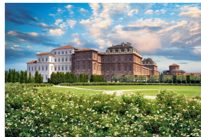
Palais de La Venaria Reale