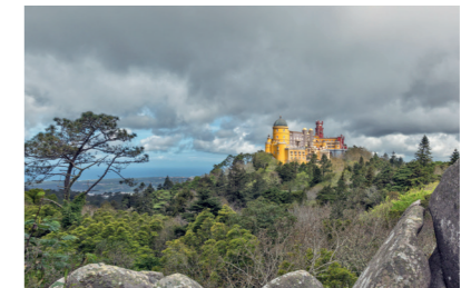
Palais National de Pena © PSML/Wilson Pereira (2016)