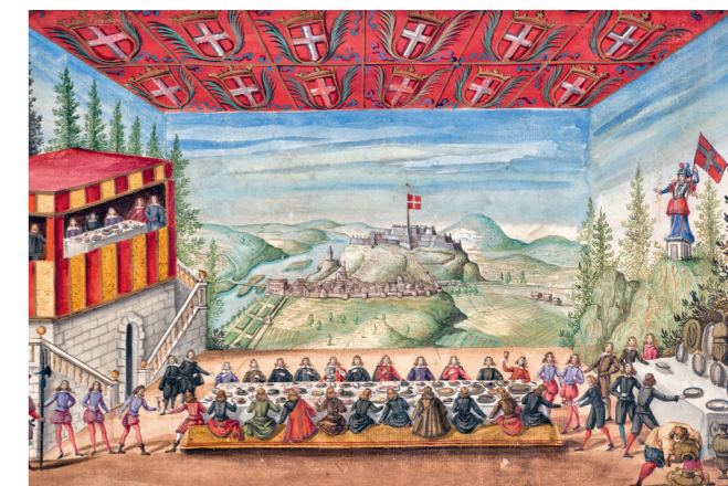
Repas de la cour de Savoie dans le salon du Château de Rivoli (1645), par T. Borgonio