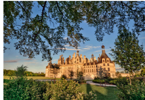
Jardin anglais.