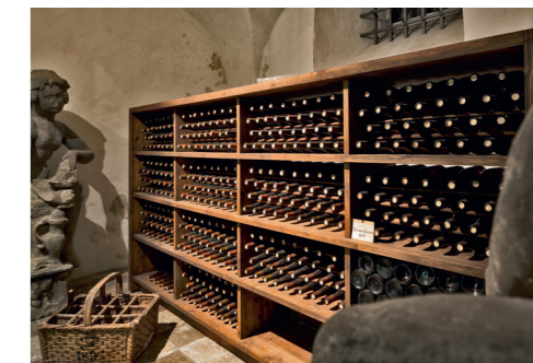
Le vin de Rosenborg