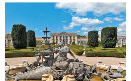
Palais National de Queluz, la Façade cérémoniale et les Jardins suspendus.