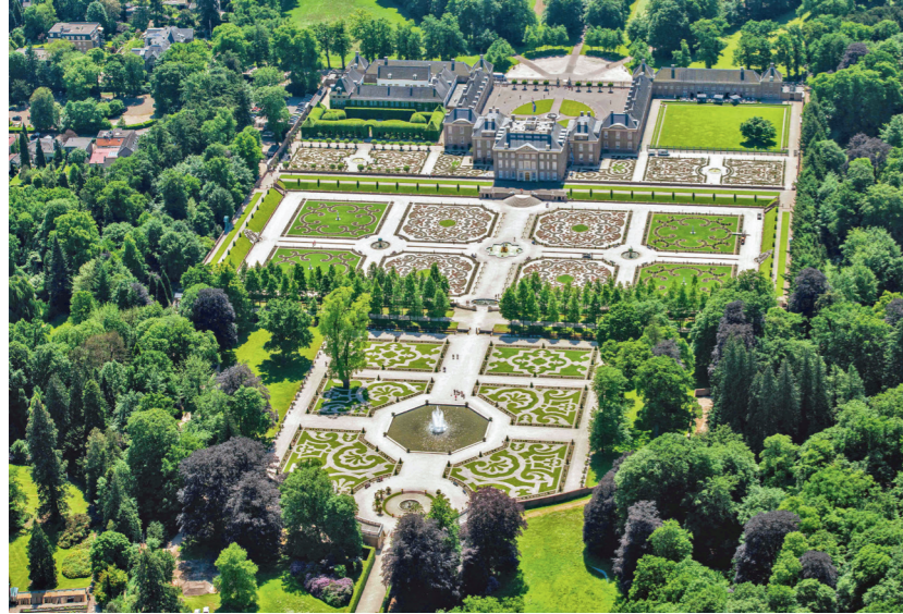
Paleis Het Loo.