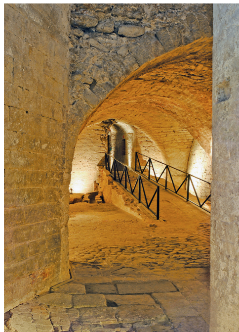
Caves du corps du logis.