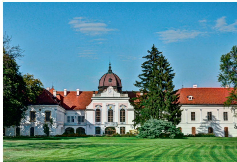
Parc du Palais royal