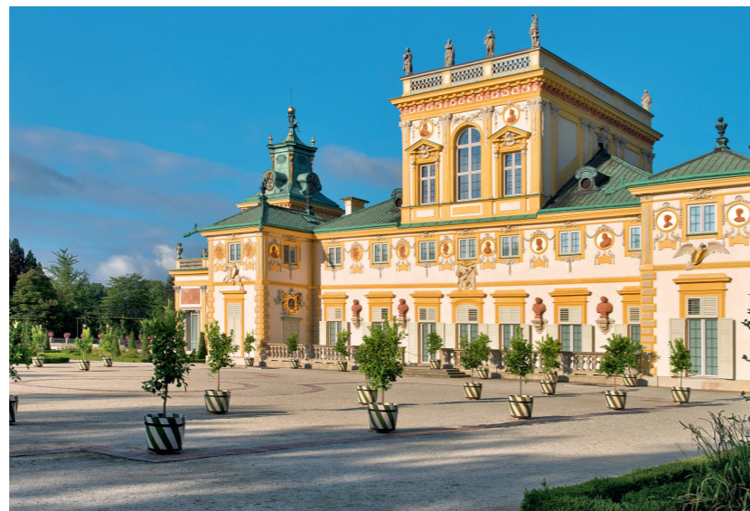
Musée du palais de Wilanów