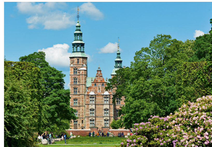
Le château de Rosenborg