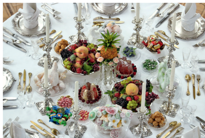
Table dressée pour l'exposition « Prince Pückler », ©SPSG Droits réservés

Dans le cadre de notre festival international de musique à Potsdam (Musikfestspiele Potsdam Sanssouci), le samedi 23 juin 2018 sera une journée spéciale, comme dans d'autres