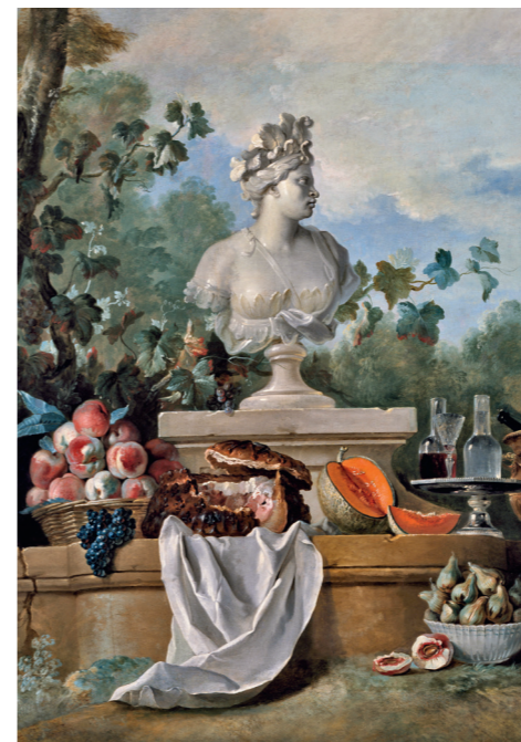
Nature morte au buste de l'Amérique, par Jean-Baptiste Oudry (1686-1755)