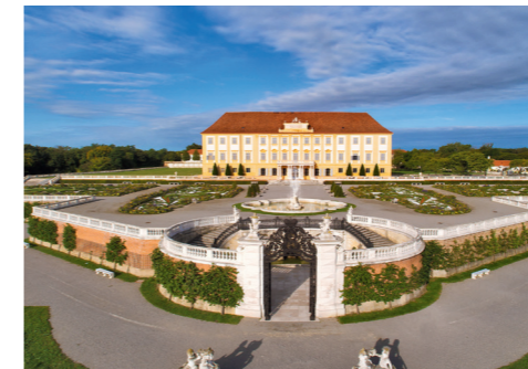
Schloss Hof