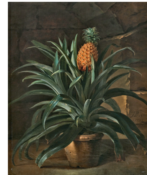
Detail de l'Ananas, par Jean-Baptiste Oudry (1686-1755)