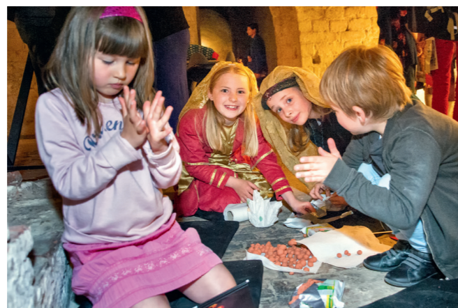
Le Palais du Coudenberg. « Family Day », © Véronique Evrard