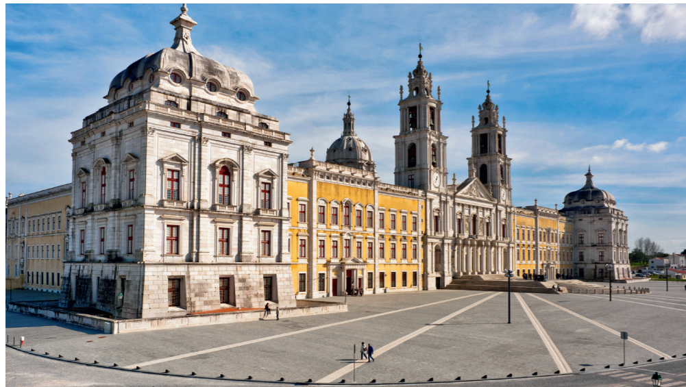
Palais National de Mafra.