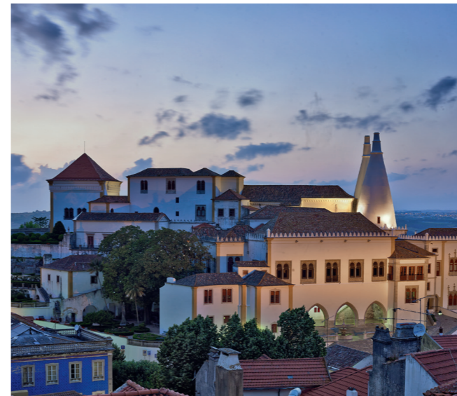
Palais National de Sintra.